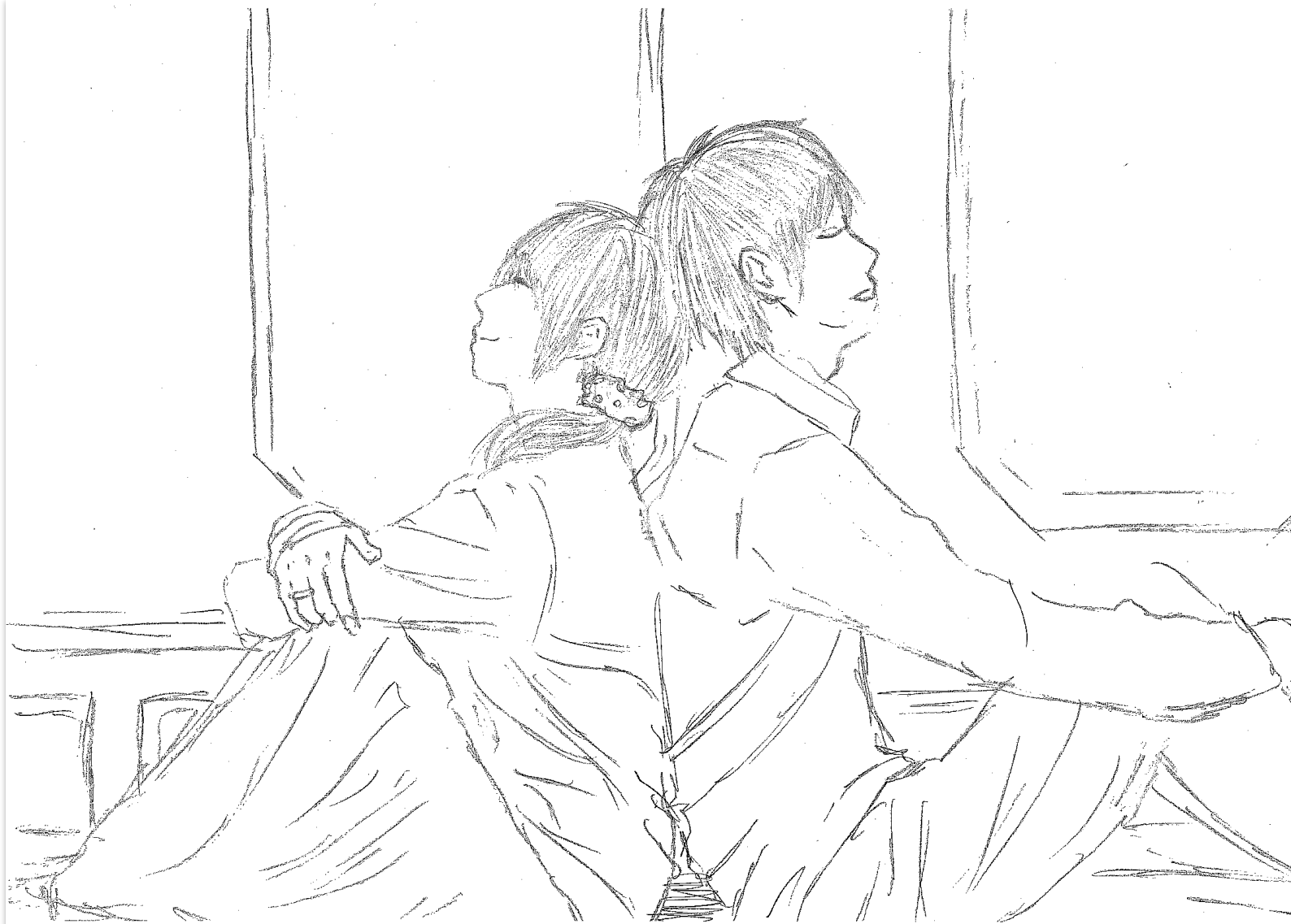
イラスト 河辺 遊